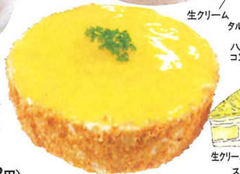
生クリーム チーズ オムレット スポンジ