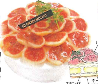
いちじく 生クリーム

18cm 本体価格3,200円 (税込3,456円) カット…… 本体価格400円 (税込432円)