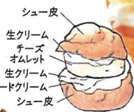
シュー皮 生クリーム チーズ オムレット 生クリーム カスタードクリーム シュー皮